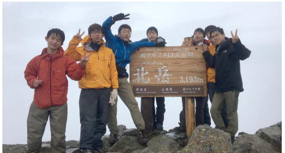
現役・2017 年の夏合宿・北岳で